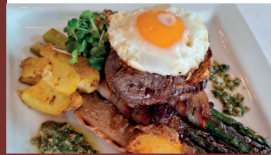
Spargel & Steak 12.4.-23.4.2024